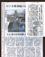
氷室作太夫家住居の 保存活用を進める会