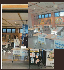
一般社団法人 空き家の窓口