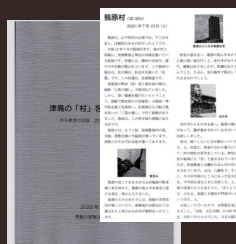
津島の宝物ひろめ隊