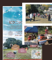
糸車の会 犬山の伝統と暮らしを楽しむ会