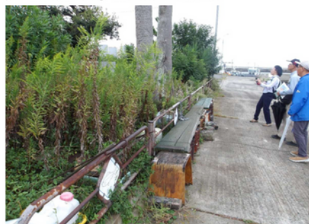
参考 漁港の既設ベンチ① 漁師等のコミュニケーション場所として