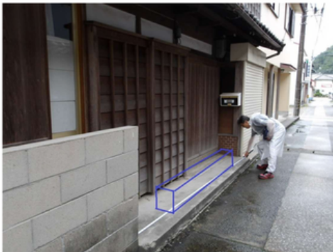
②旧前田人形店 軒下