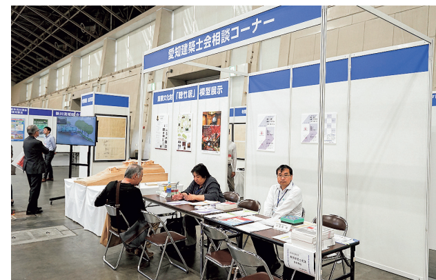
建築士会会員による建築相談