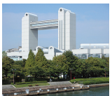
名古屋みなと支部