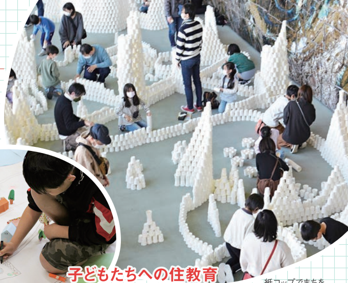
子どもたちへの住教育