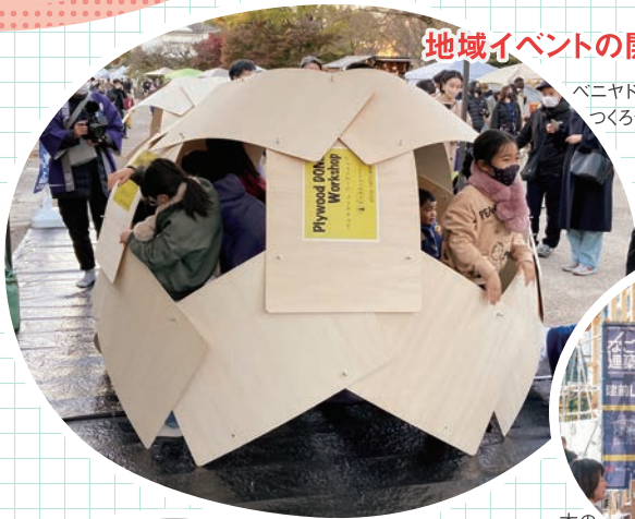
地域イベントの開催