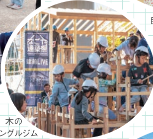
木の ジャングルジム