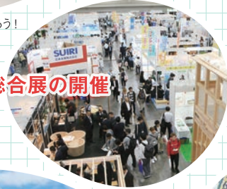
建築総合展の開催