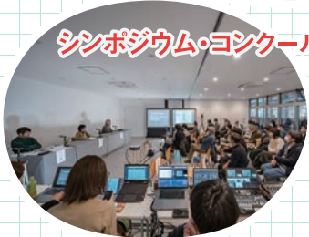
シンポジウム・コンクールの開催